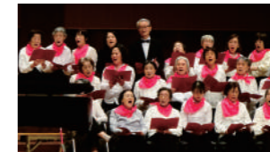
2019年に大阪のザ・シンフォニーホールで開催した「第2回輝きチャリティ・コンサート」

IGFCとは、生きることを楽しみながら毎日をお過ごしいただくためのケアの手法です。ロングライフグループのサービスは全て、思想に基づきお客様のライフスタイル全般までをコーディネートさせていただきます。