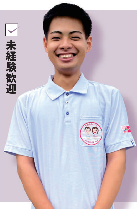
20代男性 新入社員Sさんの場合